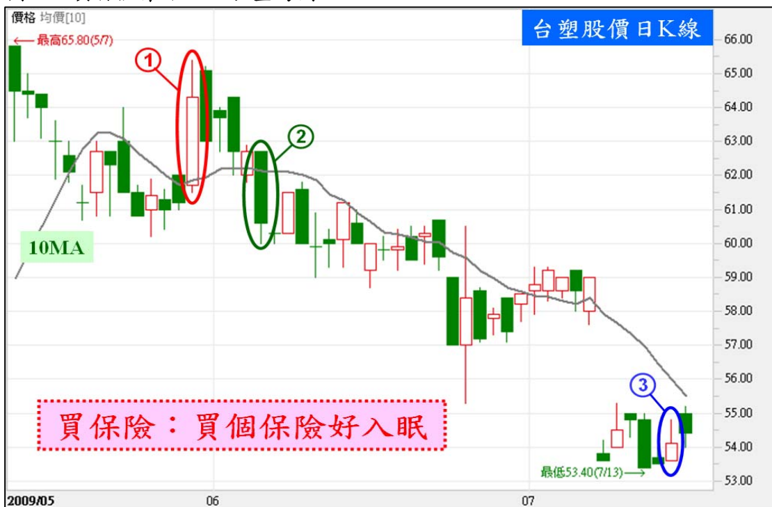
圖四：買保險策略—以台塑為例。

(3)到期結算：結算價54元，如果沒有買保險，期貨部位將虧損 64.3-54=10.3 元，但選擇權部位獲利3元，有效將整組虧損限制在每股7.3元。