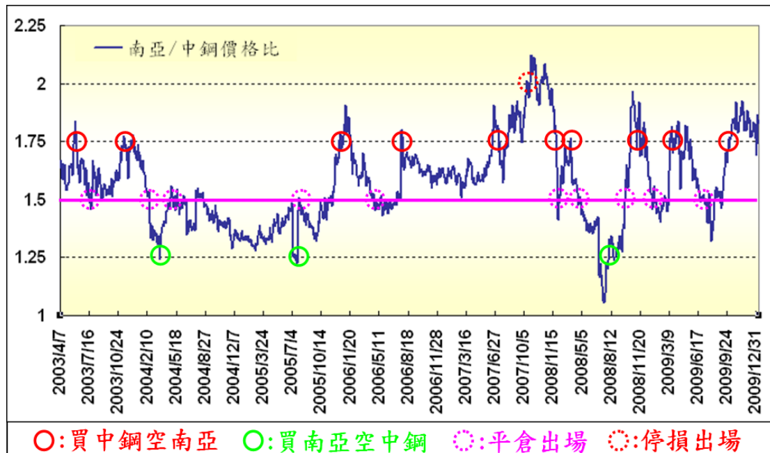
圖三：對對碰策略—以南亞及中鋼為例

在不考慮股票配股配息及漲跌停之流動性問題下，從 2003 年至 2009 年的資料背景，傳產股中的南亞和中鋼股價比率取迴歸值後大致在 1.5 附近上下波動，依歷史經驗來看，若此比率偏高至 1.75 時，代表南亞股價偏高、中鋼股價偏低，則可擇機買進中鋼、放空南亞；相對地，若股價比率偏低至 1.25 時，代表中鋼股價偏高、南亞股價偏低，則可伺機買進南亞、放空中鋼，這策略是屬於買弱空強看收斂的交易方式，並另設停損點為比率來到 2 及 1 時，將部位於收盤時出場，依圖中獲利平倉的次數來看，表現則是相對亮眼。