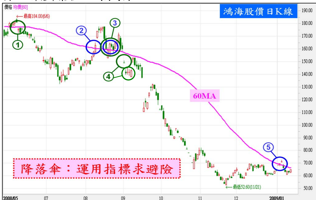
圖二：降落傘策略—以鴻海為例

但是現在推出為股票量身訂做的避險工具—股票期貨作為崩盤的降落傘，避險不完全的問題立即迎刃而解。『降落傘策略』的基本精神在於，一旦出現危機，就快拉開降落傘，以求安全降落。當手中持有股票，可藉由指標判斷股價是否有反轉疑慮，隨即進場避險，操作範例如圖二。