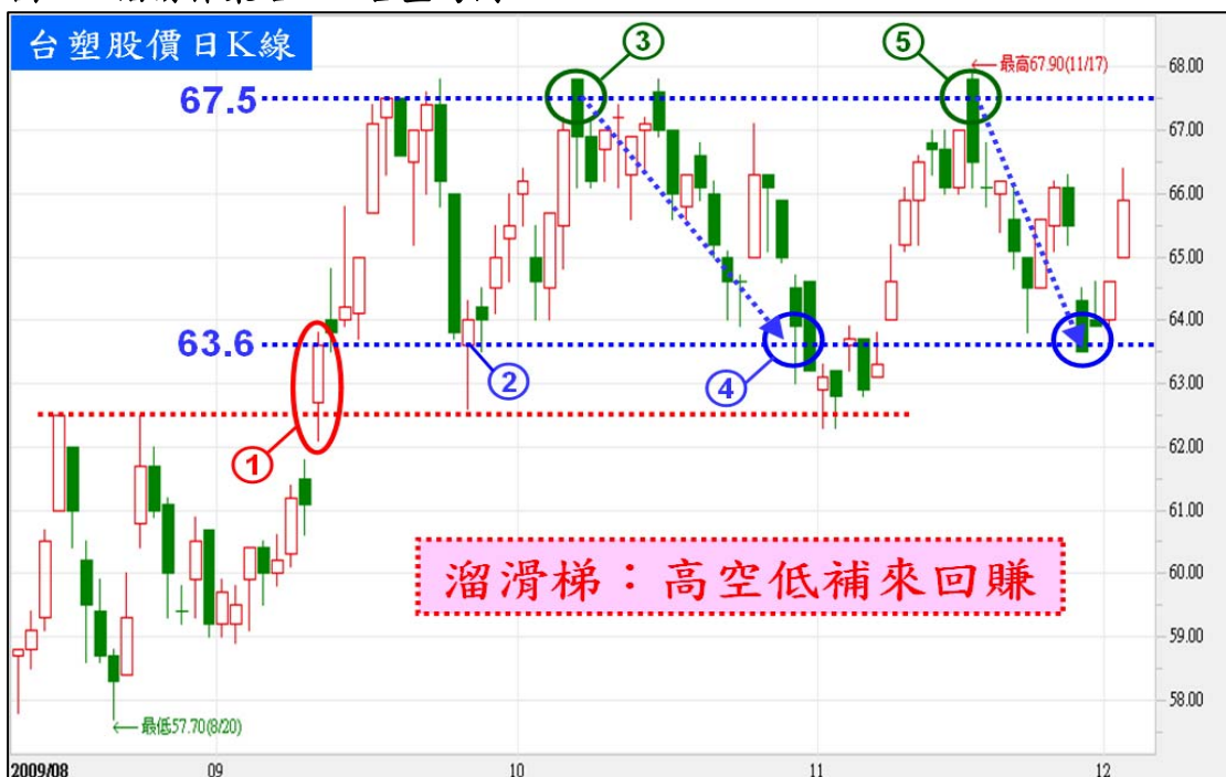
圖一：溜滑梯策略—以台塑為例

當投資人持有股票之後，股價可能轉為震盪整理，好不容易漲上去，不久卻又跌回來，投資人的心也隨著股價上下擺盪。與其讓股價的起伏影響持股信心，不如利用震盪格局的特性賺取高低差價，在股價遭遇壓力的時候先行放空股票期貨，鎖定波段獲利，等股價跌下來再來回補期貨空單，此時手中的股票部位都沒有動作，但高低差價已經先行入袋。『溜滑梯策略』就是高空低補來回賺，在爬上溜滑梯之後佈局期貨空單，接著享受股價下滑的利潤，操作範例如圖一。